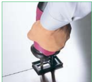
●別売のステンレス切断用ジグソーブレード使用例