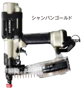
シャンパンゴールド