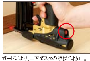
ガードにより、エアダスタの誤操作防止。