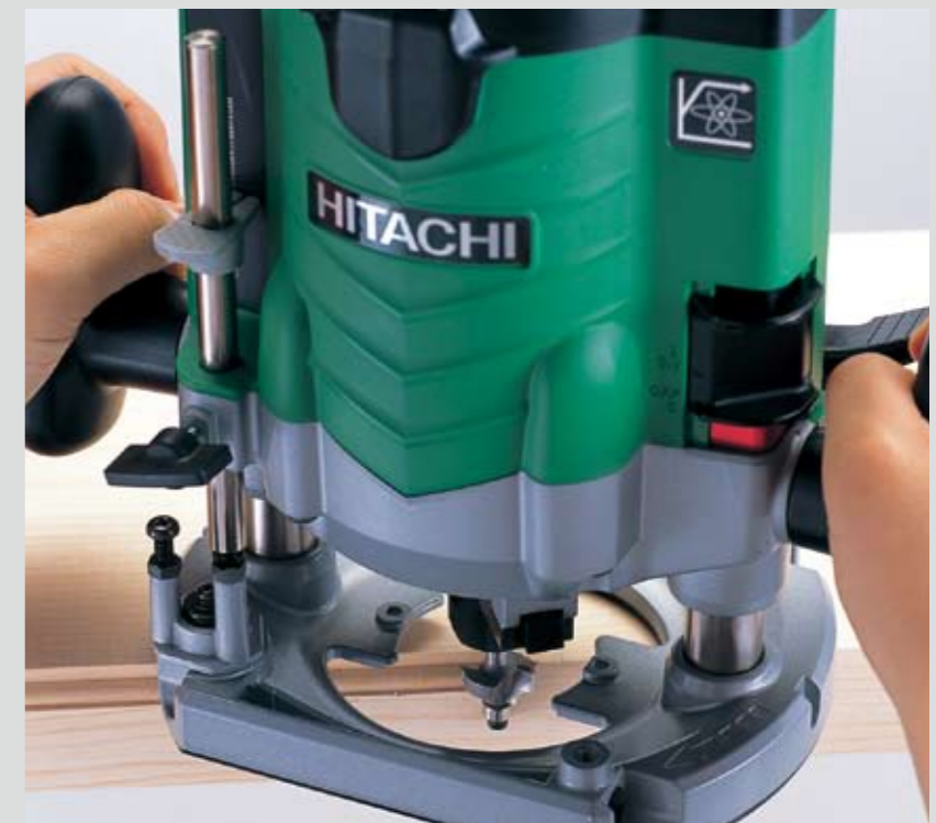
コロ付ビット(別売)による切削作業。

ストップブロックを回転させることで3段階の切込み深さが設定できます。(微調整可能)